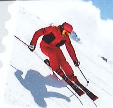
SKI DE PISTE