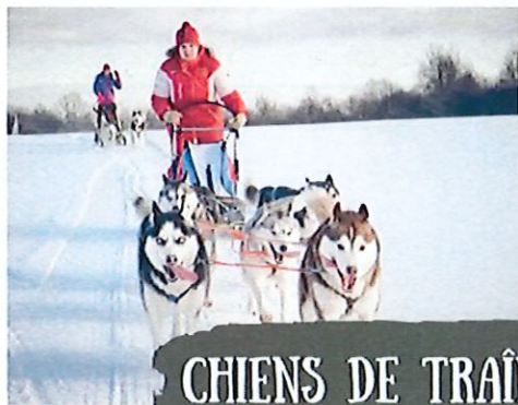
CHIENS DE TRAÎNEAUX

- Du 19 au 23 février 2024 pour les 11 / 14 ans -