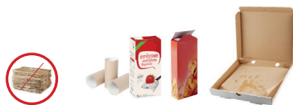
Emballages en papier et carton